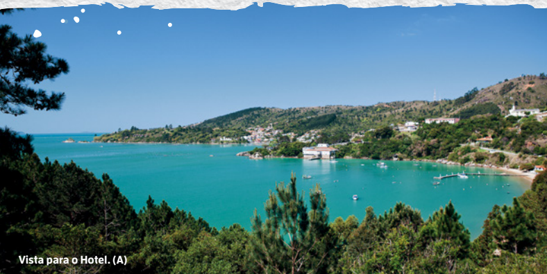
Vista para o Hotel. (A)