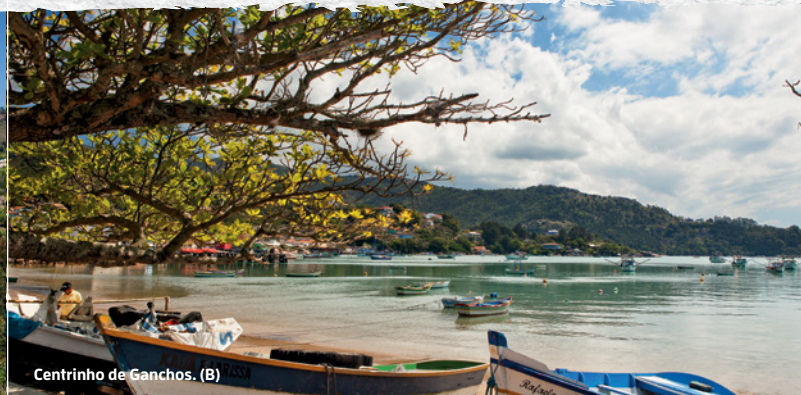
Centrinho de Ganchos. (B)